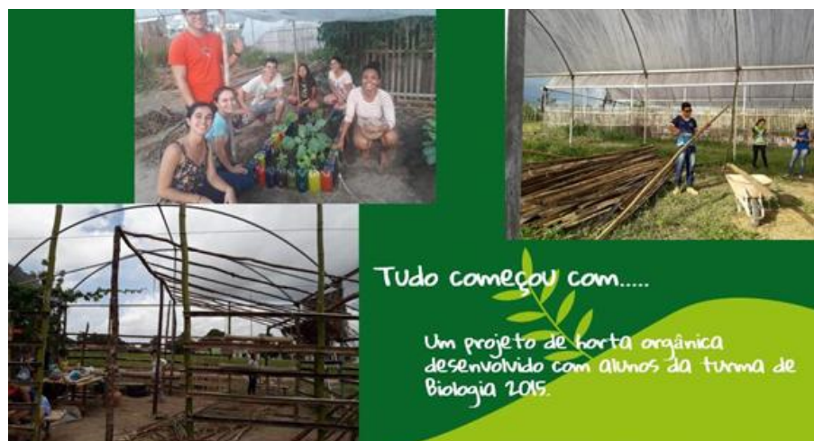
Figura I: Produção de horta com garrafas PET, visita guiada ao espaço da SVA

barreiras epistemológicas e institucionais que as separaram, historicamente. Essa intenção se materializou, inicialmente, por meio de visitas guiadas ao campus, oficinas de construção com materiais recicláveis (bambu, pneus, garrafas PET), implantação de hortas e espaços de socialização decorados com plantas medicinais.