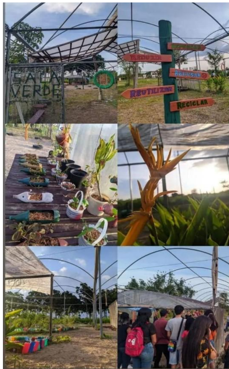
Figura II: Imagens da SVA e visitação de alunos da rede pública da região.