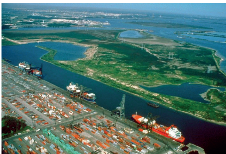
Figura 1 - Acervo da Semente Social