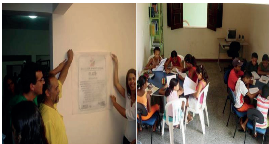
Figura 2 - Biblioteca Semente Social da ACIB

Além disso, acentua-se que a Biblioteca Semente Social deve prestar serviços utilitários à comunidade, entre eles orientações sobre projetos de assistência social do bairro, emissão de documentos, coleta alternativa, reciclagem, manifestações culturais da comunidade (Grupo Independente de Teatro Amador - GRITA; Projeto Congo-Aruandê; etc.), conforme Figura 2: