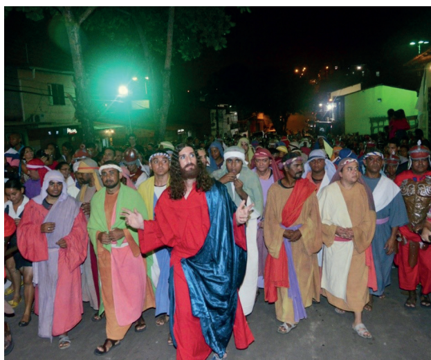
Figura 3 - Via Sacra do Grupo GRITA