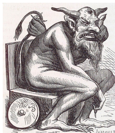
Belfegor , associado à Preguiça