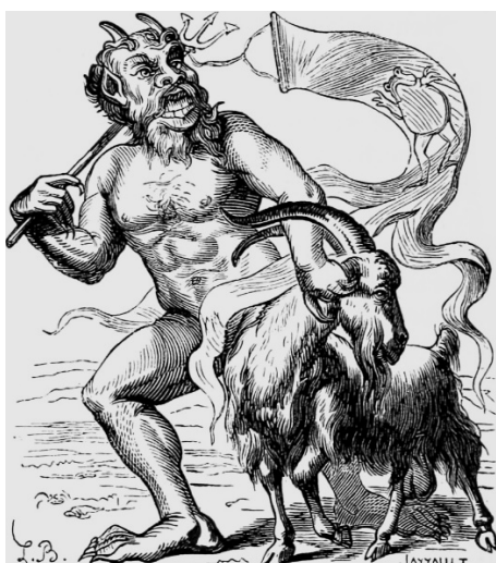
Azazel , associado à Ira