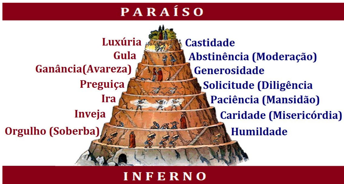
Figura 1 – Ilustração da pirâmide hierárquica dos sete pecados capitais e seus opostos.

Fonte: O próprio autor baseado em “A Divina Comédia - Purgatório” de Dante Alighieri.