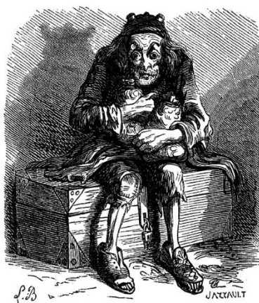
Mamon , associado à Avareza/Ganância