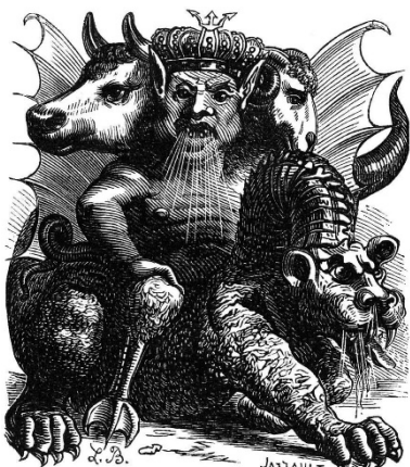
Asmodeus , associado à Luxúria