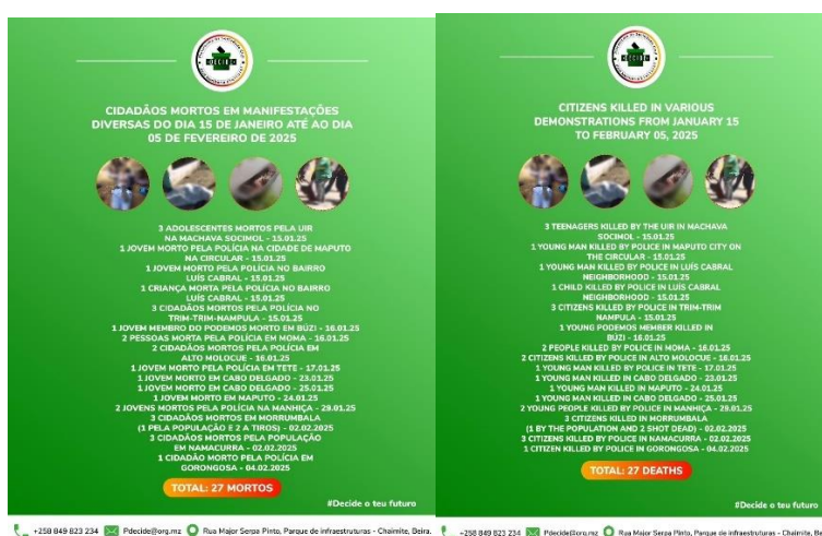
Imagem 2: “Dados das mortes em manifestações diversas nos últimos 20 dias que elevam para 327 o número de vítimas desde 21 de outubro de 2024.”