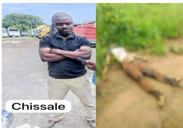
Imagem 4: vítimas mortais

A "Plataforma Eleitoral Decide" defende o diálogo como solução para restaurar a estabilidade política, posição respaldada pela literatura sobre resolução de conflitos (Galtung, 2000). No entanto, para que o diálogo seja eficaz, são necessárias garantias de não perseguição e compromisso com reformas políticas. Experiências internacionais, como a Comissão da Verdade e Reconciliação na África do Sul (Gibson, 2004), destacam a importância de mediações neutras e independentes. Sem avanços nesse sentido, Moçambique enfrenta o risco de aprofundamento da crise, com impactos negativos para a governabilidade e a paz social, aumentando o ciclo de pobreza, miséria e instabilidade.