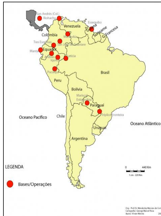
Figura 1 – Bases norte-americanas na América do Sul

Costa (1999) destaca o cerco formado pelos Estados Unidos. Segundo o autor, isso desperta preocupações dos países que compõem a região, pois a concentração das bases marca agora a presença militar, criando uma barreira na fronteira brasileira. Além dessa nova realidade, existe um mosaico de situações na Amazônia.